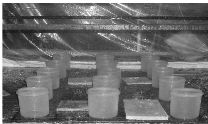
شکل ۱- نحوه‌ی قرارگیری ظروف بر روی صفحه‌ی آزمایش

x: اختلاف ارتفاع آب در هر استوانه با میانگین ارتفاع آب می‌باشد (Christiansen, 1941).