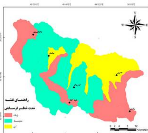
شکل ۴- نقشه وضعیت شدت فرسایش در روش امتیاز عاملی

نتایج درصد همپوشانی و محاسبه مقادیر اختلاف نسبی بین مقادیر شدت فرسایش با بکارگیری روش شاخص فورنیه و امتیاز دهی عاملی در مقایسه با مدل EPM در حوزه آبخیز مورد مطالعه (مزلقان)، در جدول ۸ آورده شده است.