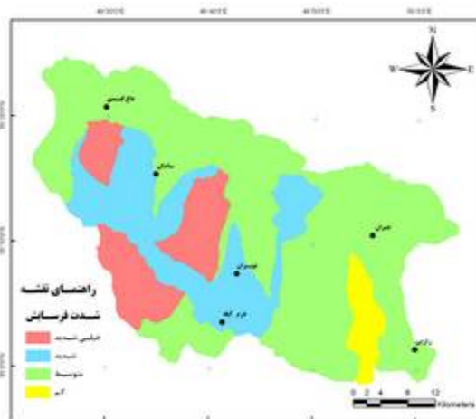
شکل ۲- نقشه وضعیت شدت فرسایش در روش EPM

مقادیر فرسایندگی باران با استفاده از روش فورنیه در ۲ کلاس (کم و زیاد) طبقه بندی شده است و در جدول ۴ ارائه شده است. همچنین نتایج شدت فرسایش حاصل از اجرای روش فورنیه در محیط GIS در جدول ۵ ارائه گردیده و در شکل ۳ آورده شده است.