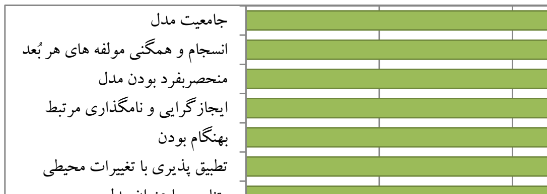
شکل ۲: میانگین امتیازات کسب شده‌ی مؤلفه‌های مدل از نگاه خبرگان

در ادامه برای تأیید اعتبار و روایی مدل پیشنهادی پژوهش، به دریافت دیدگاه خبرگان در این زمینه پرداخته شده است. در این راستا، ۸ سؤال مدنظر است: جامعیت مدل، انسجام و همگنی مؤلفه‌های هر بُعد، منحصر به فرد بودن، ایجاز‌گرایی و نامگذاری مرتبط، بهنگام بودن، تطبیق‌پذیری با تغییرات محیطی، متناسب با عنوان مدل، مناسب و گویا بودن الگوی گرافیکی (Bandarian et al, 2012 & Zahedi and Sheikh, 2010 & Kianfar, 2018). بدین منظور برای سنجش میزان موافقت خبرگان با هر سؤال، طیف لیکرت ۵ قسمتی (از خیلی کم (امتیاز ۱) تا خیلی زیاد (امتیاز ۵)) در نظر گرفته شد. سپس با تشکیل پانل خبرگان متشکل از ۱۵ خبره در زمینه‌ی مدیریت و حفاظت از جاذبه‌های ژئوتوریستی، سؤالات مطرح و پرسیده شد. مطابق با شکل ۲، میانگین آماری همه سؤالات بیش از میانگین نظری (۳) می‌باشد. بر این اساس، میانگین آماری سؤالات بدین شکل است: جامعیت مدل برابر با ۴/۱۱، انسجام و همگنی مؤلفه‌های هر بُعد برابر با ۳/۹۸، منحصر به فرد بودن مدل برابر با ۳/۸۸، ایجاز‌گرایی و نامگذاری مرتبط برابر با ۴/۲۱، بهنگام بودن برابر با ۳/۷۴، تطبیق‌پذیری با تغییرات محیطی برابر با ۴/۰۲، متناسب با عنوان مدل برابر با ۴/۴۴ و مناسب و گویا بودن الگوی گرافیکی برابر با ۴/۱۳ (شکل ۲).