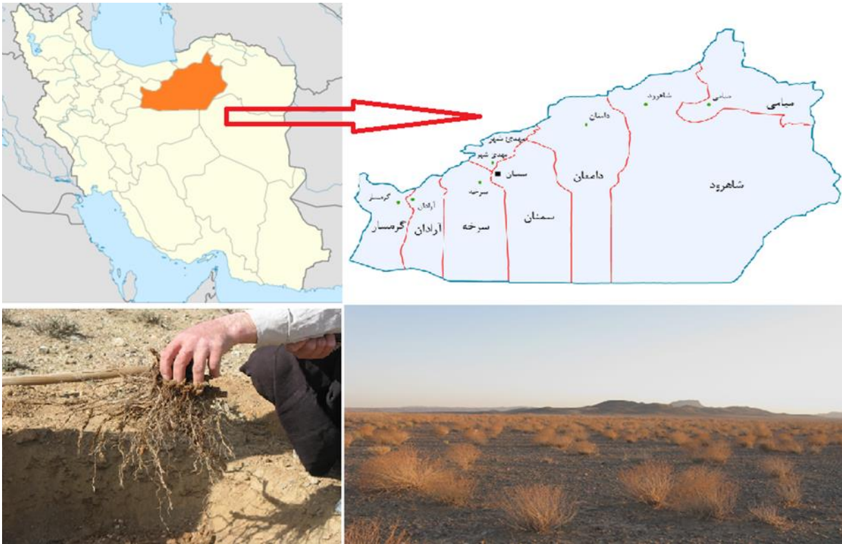
شکل ۱: موقعیت مناطق مورد مطالعه و نمونه برداری در استان سمنان