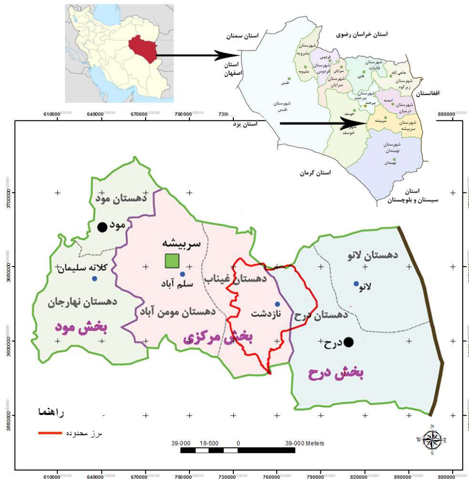
شکل ۲: نقشه‌ی منطقه‌ی مورد مطالعه