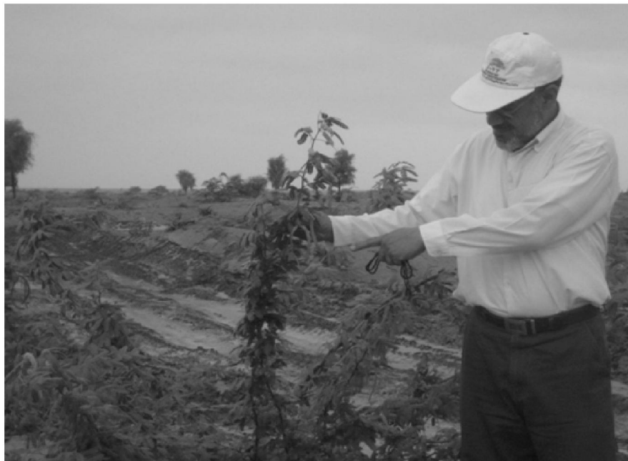
شکل شماره ۲- نهال سمر در پایان سال دوم