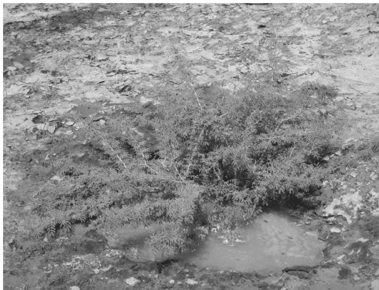
شکل ۱- نهالکاری با گونه مغیر - پایان سال اول

به منظور مقایسه میزان رشد نهالها، در پایان سال اول و دوم به اندازه گیری سطح تاج پوشش نهالها برای هر گونه به روش اندازه گیری سطح تاج همه پایه ها، اقدام گردیده است. (آنچه که در این تحقیق به عنوان رشد مدّ نظر بوده، میزان تاج پوششی است که در پایان سال اول و دوم ایجاد می نماید)؛ همچنین درصد زنده مانی نهالها و طول فصل خزان در منطقه نیز به تفکیک گونه برآورد شده است. اشکال (۱) و (۲) وضعیت دو گونه مغیر و سمر را به ترتیب در پایان سال اول و دوم نشان می دهد.